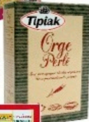
Orge perlé, Tipiak, 250 g, environ 0,90 €, en GMS.