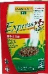
Epeautre Express, Danival, 250 g, env. 2,71 €, magasins bio.