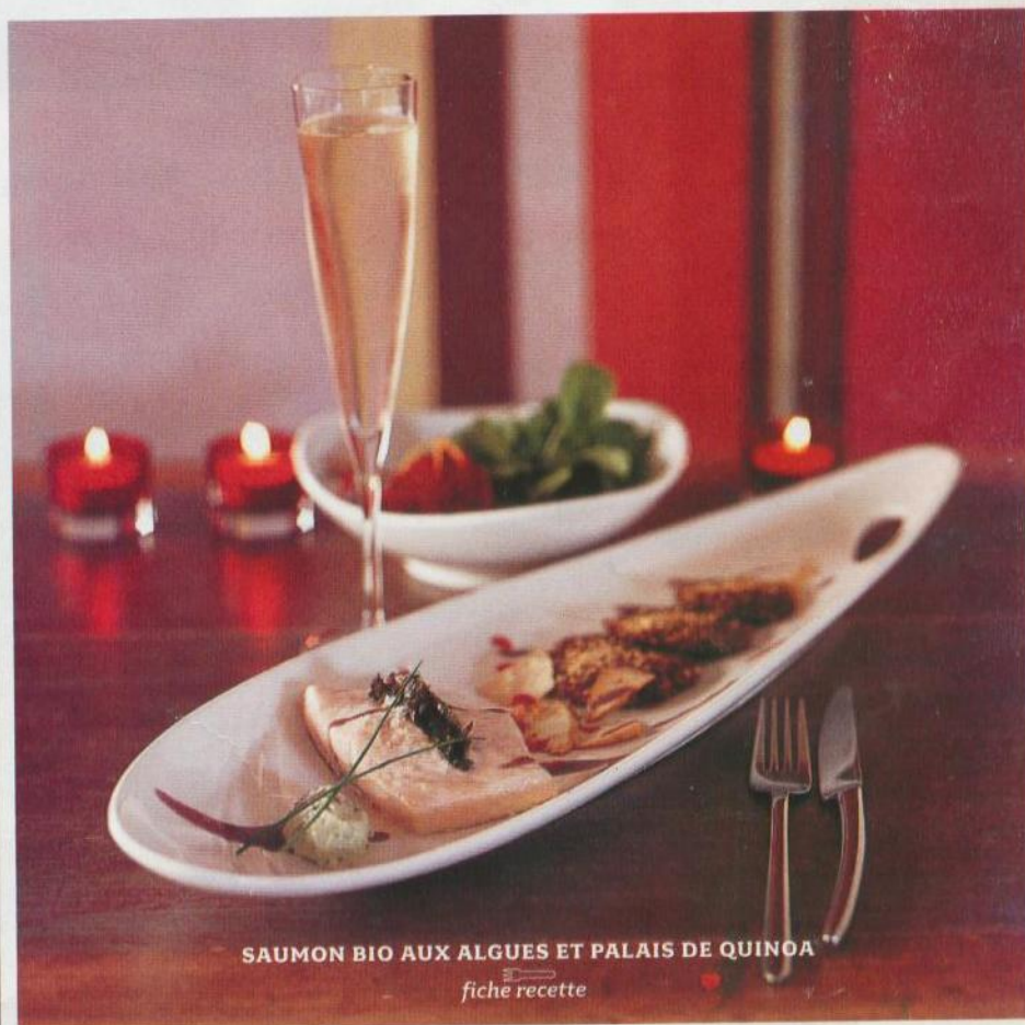
SAUMON BIO AUX ALGUES ET PALAIS DE QUINOA fiche recette

Un saumon écossais à la chair pâle uni aux saveurs des algues, du quinoa et du sésame grillé amplifie la généreuse musique du Billecart-Salmon.